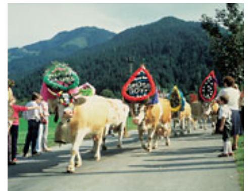
Alm-Abtrieb in Soell

Verwaltungsstruktur: 9 Bundesländer (Burgenland, Kärnten, Niederösterreich, Oberösterreich, Salzburg, Steiermark, Tirol, Vorarlberg, Wien).